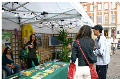
Stand Eaux Vives Canoe-Kayak, Escalade, Randonnée, VTT... tout est possible