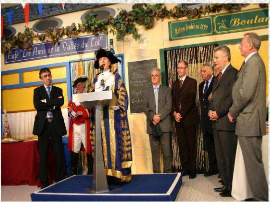
Le discours de la Lord Mayor sur la Place de Village