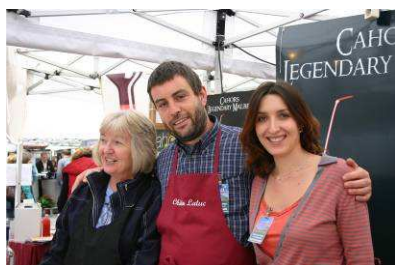
Des producteurs de vin de Cahors