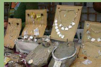
Les Bijoux Aveyronnais de Lyseth Création