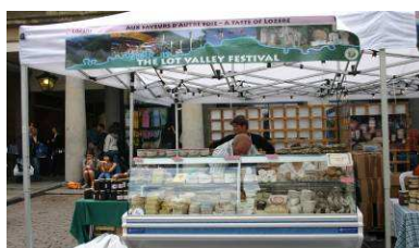
Un avant goût de Lozère