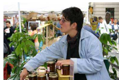
Pruneaux d'Agen et Chateau Lalande