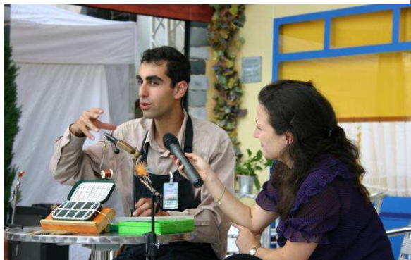
Démonstration de fabrication de mouches par la fédération de Pêche du Lot et Garonne