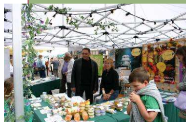
Les terrines et pâtés du Ledat