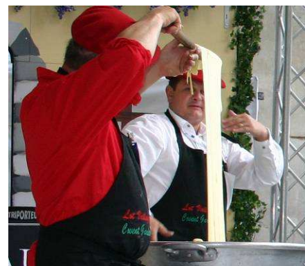
Démonstration d'Aligot par notre Fromager du Cantal

Tous nos remerciements à nos prestataires qui ont généreusement donné de leur temps pour faire découvrir des activités traditionnelles de nos régions.