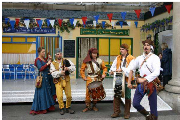
Les troubadours devant la place de village