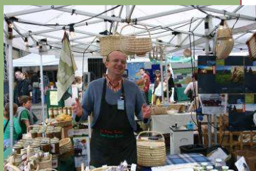
Les Bisons du Cantal

Et tant d'autres producteurs, artisans et prestataires, qui par leur gentillesse, leur savoir-vivre, leur simplicité, ont donné une image positive, sympathique et dynamique de notre territoire et de ses produits.