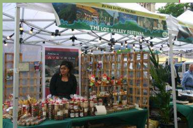
Du miel pour adoucir le ciel