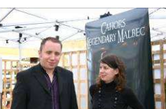
Visages des vignes