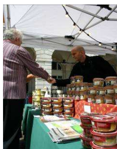
Terrines et Foie-gras du Quercy