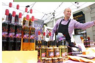
Le Safran du Quercy