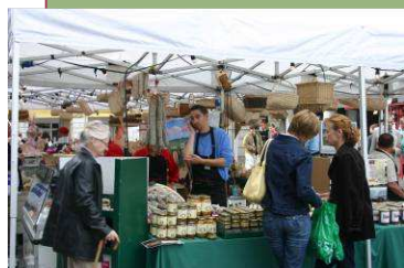
Douceurs du Cantal