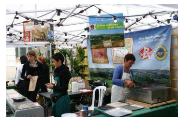
Le Veau d'Aveyron

Et tant d'autres producteurs, artisans et prestataires, qui par leur gentillesse, leur savoir-vivre, leur simplicité, ont donné une image positive, sympathique et dynamique de notre territoire et de ses produits.