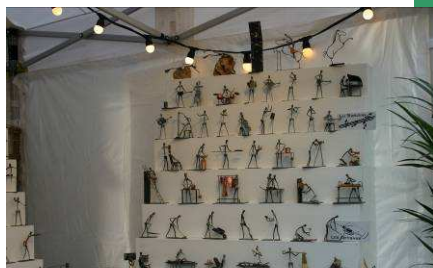
Les Clous de Laguiole