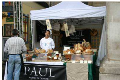
Une boulangerie "presque" française